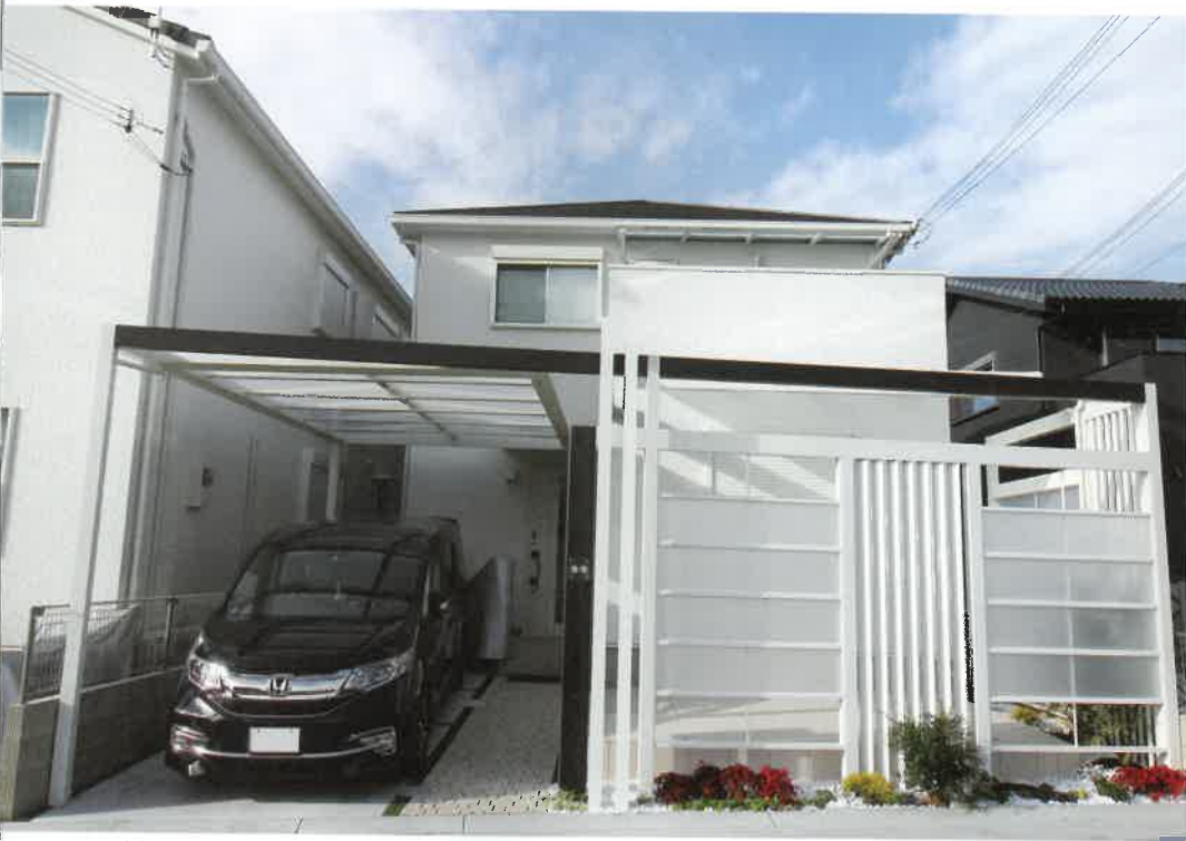
右側の植栽はマホニア・コンファー、オタフクナンテン、フィリフェラオーレア、ヒューケラ、ヤブランなど。