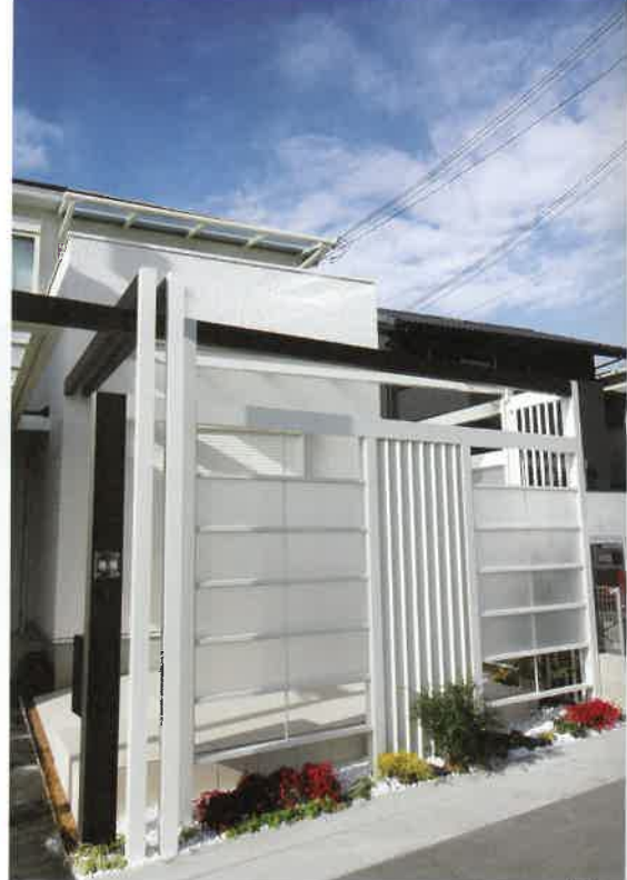
スタイリッシュなスクリーン。