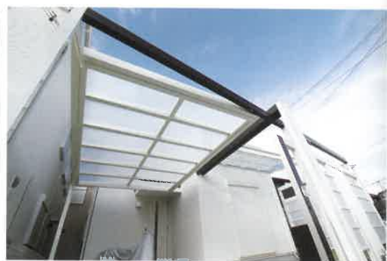
上 スタイリッシュな屋根。 左 道路に面した部分はデザイン格子で道路からの視線をさえぎり、光と風を取りこめるセミクローズなタイルテラスを作成。シンボルツリーはオリーブ。