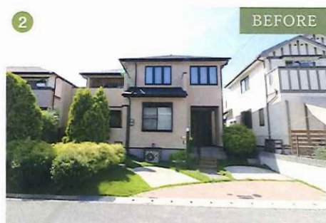
①エクステリア全景。向かって左側の小さな森のようなお庭はそのまま残したリフォームです。車を止めやすくするため、門柱は建物側に移動。②～④施工前。