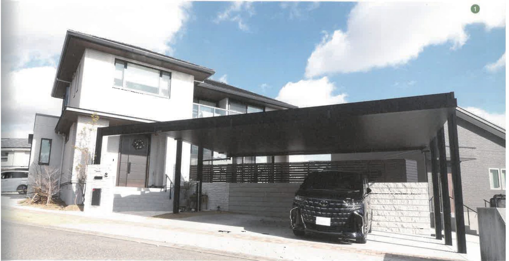
①エクステリア全景。迫力満点の大型カーポートです。②③施工前。