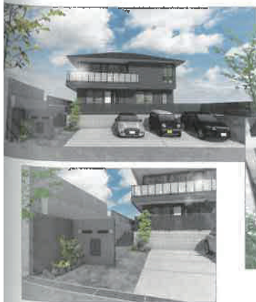
パース 作成=エクステリアデザイン神戸